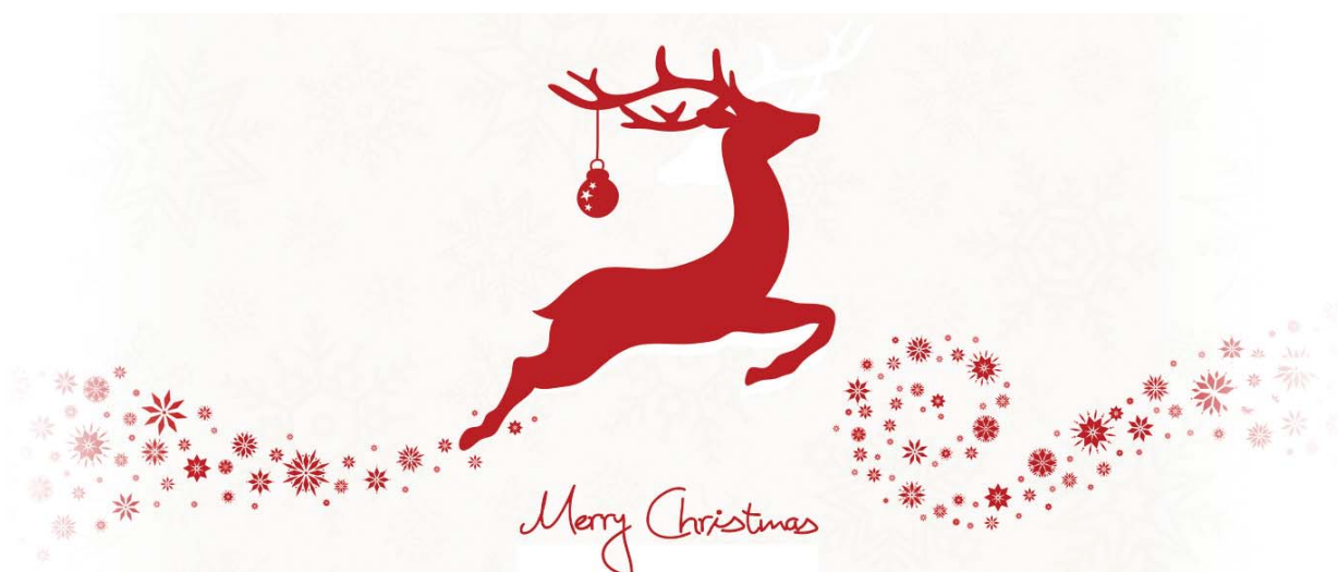
Ihre Anke Elferich

Zum Jahreswechsel möchten wir uns herzlich für Ihre Unterstützung und Ihr Vertrauen bedanken und wünschen Ihnen für das neue Jahr Gesundheit, Zufriedenheit, Glück und Erfolg.